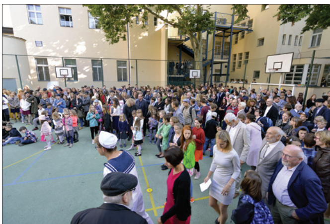
Lauderovy školy – zahájení školního roku 4. září 2017

Také v roce 2017 dotovala ŽOP významným způsobem činnost Lauderových škol (28 % rozpočtu školy). Lauderovy školy představují jedinečný vzdělávací projekt určený dětem, žákům a studentům se zájmem o výchovu v duchu židovství. Základní škola vznikla v roce 1997, od roku 1999 existuje gymnázium a od roku 2009 mateřská škola. V září 2016 byl obnoven 2. stupeň ZŠ. Výuka na všech vzdělávacích stupních probíhá podle vlastního školního vzdělávacího programu Le chajim , vycházejícího z rámcových vzdělávacích programů pro předškolní, základní a gymnaziální vzdělávání, navíc obohacených o židovská specifika – židovskou výchovu a hebrejštinu. Na konci roku 2017 bylo v MŠ, ZŠ a v gymnáziu Lauderových škol 317 žáků a studentů.