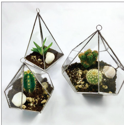
Aerarium, dílna Becalel, www.becalel.cz

V oddělení působili v průběhu roku tři zahraniční dobrovolníci z Německa a Rakouska a třiačtyřicet dobrovolníků ze skupiny Tmicha.