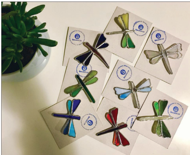
Vitráže, dílna Becalel, www.becalel.cz