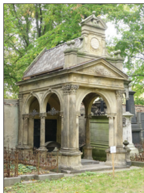
NŽH – rodinná hrobka Ignaz Fuchs (zakladatel papíren na nároží ul. Vinohradská a Votická) restaurována v letech 2014–2017

Mezi ostatní stavební akce patřila např. oprava střechy budovy tahary (dlouhodobé zatékání, poškozený strop), byla instalována technická opatření za účelem snížení rizika násilného vniknutí nepovolaných osob do šaten pracovní čety,