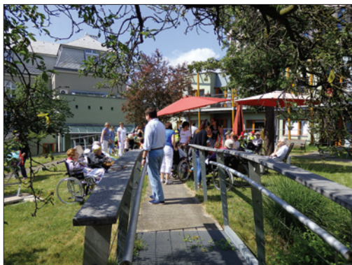
Sportovní den na Hagiboru

Akce TKC byly v roce 2017 finančně podporovány JDC, ŽOP, Nadačním fondem obětí holocaustu a v rámci dotačního programu MHMP.