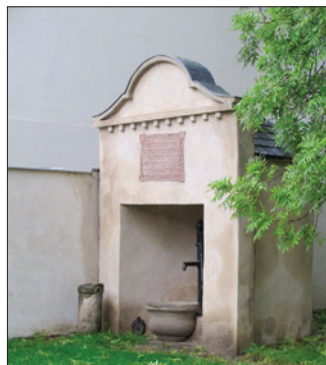
SŽHŽ – Zappertova studna, restaurována v letech 2015–2017 (Wolf Gadels Zappert, 1731–1810, představený pohřebního bratrstva, za jehož působení byla studna vystavěna)

Jako každoročně proběhl i zdravotní prořez stromů. Běžná údržba hřbitovní plochy (sekání trávy, úklid odpadků, listí a spadáných větví) byla zajišťována přímo ŽOP prostřednictvím klientů sociálního oddělení, a to na velmi dobré úrovni. Na úhradu části nákladů uvedených prací byl získán příspěvek NFOH ve výši 40 tis. Kč .