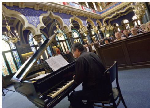
Vernisáž výstavy Romská duše – koncert klasické hudby