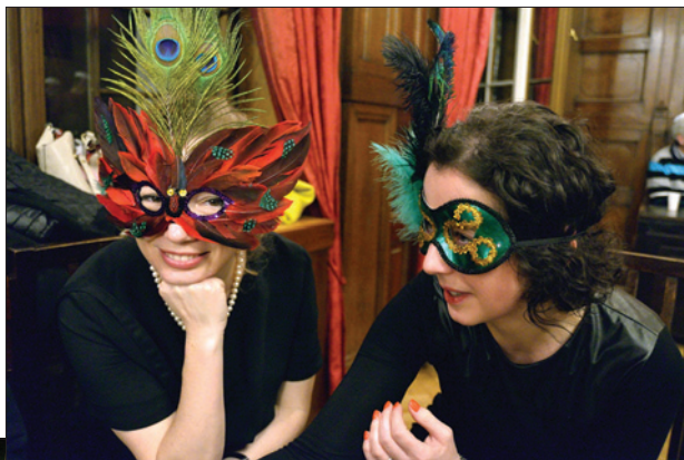
Purimová oslava na ŽOP, 11. března 2017