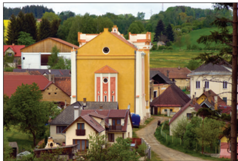
Synagoga v Nové Cerkvi, po celkové obnově v rámci projektu Revitalizace ( www.10hvezd.cz )

Původně plánovaný rozpočet SBH na rok 2017 byl ve výsledku sice překročen, vynaložené finanční prostředky však byly bez výjimky účelně využity buď jako povinná spoluúčasť k dotacím, nebo na krytí neodkladných prací souvisejících s následky nečekaných událostí a havárií.