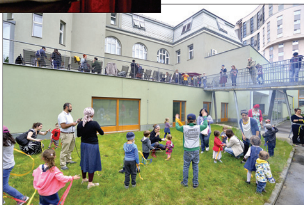
Lag Baomer, Hagibor 14. května 2017