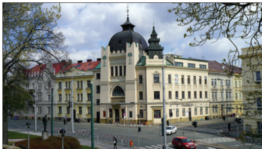
Synagoga v Hradci Králové