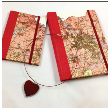
Sešity, dílna Becalel, www.becalel.cz

V Penzionu Charlese Jordana je poskytováno klientům trvalé ubytování a pečovatelská služba .