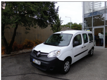
Slavnostní předání nového automobilu