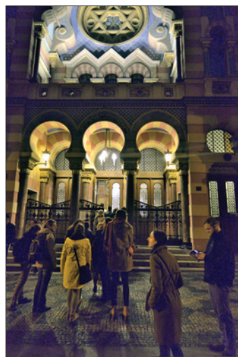
Jeruzalémská synagoga, poslední komentovaná prohlídka v roce 2017

Starý židovský hřbitov na Žižkově, tzv. první židovský hřbitov na Olšanech, byl založen v roce 1680 jako morové pohřebiště pražské židovské obce. Od 1. ledna 2014 jeho zachovalou část spravuje opět Židovská obec v Praze, když od roku 1999 tento hřbitov spravovalo Židovské muzeum v Praze, které po nezbytných stavebních úpravách a základních restaurátorských pracích umožnilo jeho otevření pro veřejnost v září 2001.