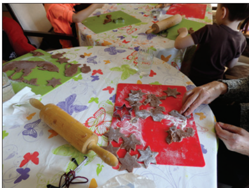
Společné pečení klientů DSPH a dětí z Bejchadu

I vzdělávání zaměstnanců v paliativní péči stále řadíme mezi vysoké priority, a to jak v části obecné, tak v části speciální. Pracovníci DSPH se aktivně účastnili akreditovaných přednášek zřizovatele v paliativní péči. Přednášky byly přímo zaměřeny na péči o naše klienty. Naše zdravotní sestry absolvovaly odborné stáže v organizaci Cesta domů a v organizaci Hospic Dobrého Pastýře Čerčany. Vzdělávání zaměstnanců v paliativní péči bude pokračovat i v následujícím roce.