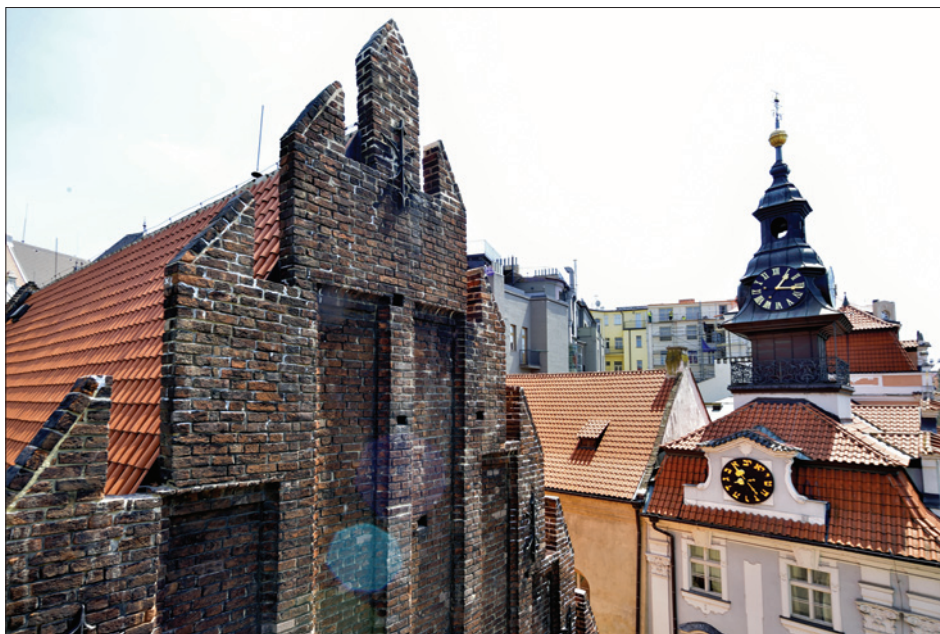
Opravený štít Staronové synagogy