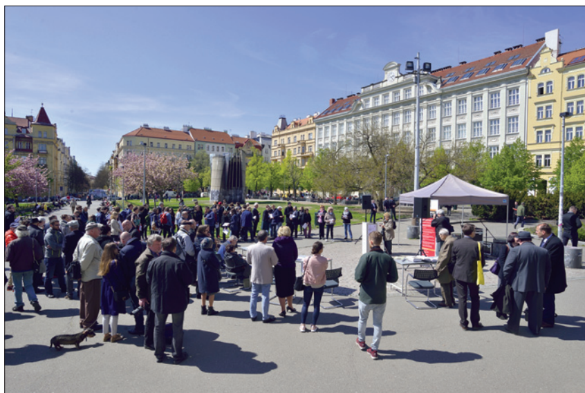
Jom ha-šoa 5777 (2017) na náměstí Jiřího z Poděbrad