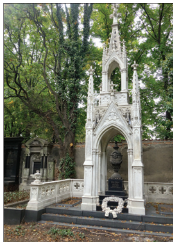
NŽH – novogotická rodinná hrobka Lederer, restaurována s dotací z tzv. Norských fondů v letech 2016–2017

Objekt hřbitova byl zapojen do projektu Den židovských památek a akcí Prahy 3.