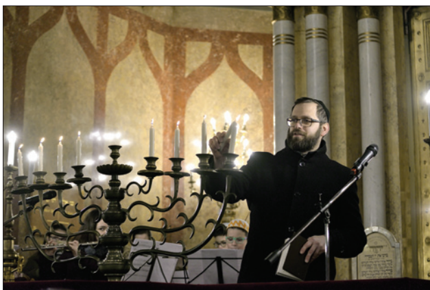
Svátky světel, Jeruzalémská synagoga, 19. prosince 2017