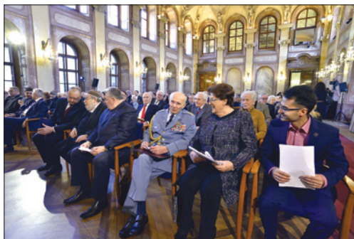
Den památky obětí holocaustu a předcházení zločinům proti lidskosti, Senát Parlamentu ČR, 27. ledna 2017