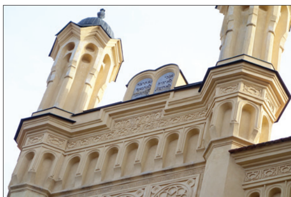
Synagoga v Písku, restaurování interiérové malířské výzdoby a Desatero nad západním průčelím budovy