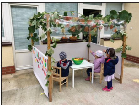
NAŠE SUKA, Program Lauderovy školky v Praze