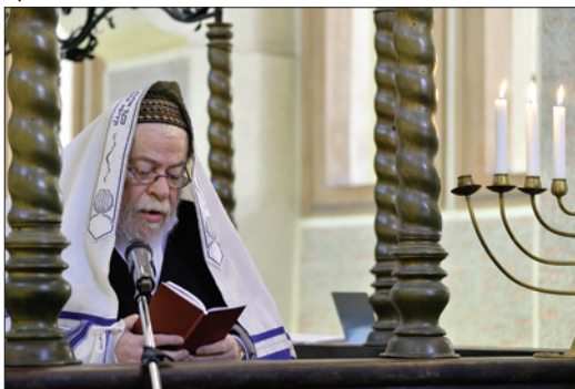
Jom ha-šoa 5777 (2017), Pinkasova synagoga, 24. dubna 2017